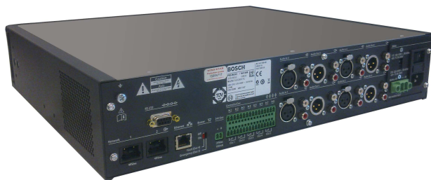
PRS-NCO3, вид сзади